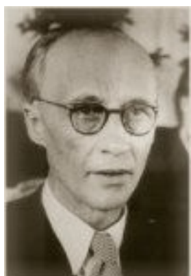
Johannes Dieckmann (1893 – 1969) Président de la Chambre du Peuple (1949-1969)

En 1950, il devient président du Front National de la DDR. Un an plus tard, il est nommé directeur de l'Institut de recherche sur les fibres synthétiques de l'Académie Allemande des Sciences à Teltow, poste qu'il occupera pendant dix ans. Entretemps, il est aussi professeur de chimie à l'Université Technique de Dresden. En 1954, il entre à la Chambre du Peuple. Il participe également aux activités de l'Association pour l'Amitié Germano-Soviétique 18 et à celles de l'Association Culturelle Allemande 19 . En 1957, il est appelé au Conseil de la Recherche, et à partir de 1960, il accède au Conseil d'Etat.