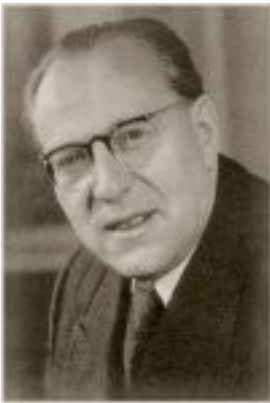
Otto Grotewohl (1894 - 1964) Président du Conseil des Ministres (1949 - 1964)

est formé aux techniques d'espionnage politique et militaire. En quatre ans, il est promu suppléant du chef de l'unité d'espionnage militaire, puis au rang de chef d'unité en 1962. Dix ans plus tard, il obtient un diplôme de juriste à l'université de Potsdam. En 1983, il devient le second de Markus Wolf, qu'il remplace en 1986.