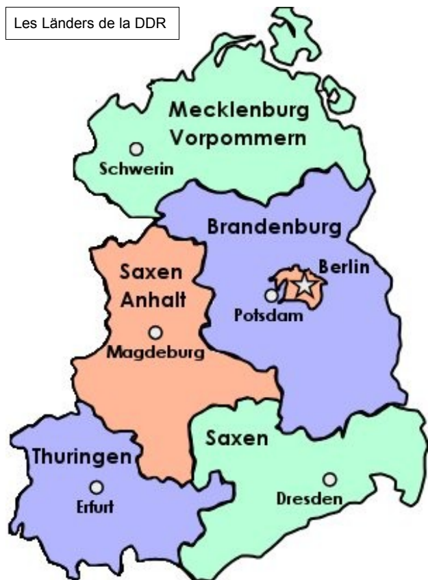
Les Länder de la DDR

Le 7 octobre 1949, la zone allemande placée sous le commandement de l'URSS devient la République Démocratique Allemande ou DDR 3 . Berlin en est la capitale. Ce statut est immédiatement contesté par les alliés occidentaux, désormais unis sous la bannière de l'OTAN.