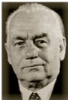
Wilhelm Pieck (1876 – 1960) Président de la DDR (1949 – 1960)

Sur ses ordres, les arrestations arbitraires, les enlèvements, et le harcèlement des dissidents, se multiplient. Le chef de la Stasi est aussi président du Sportvereinigung Dynamo , l'Association Sportive des forces de sécurité. C'est un passionné de chasse qui possède un grand domaine, dans lequel il convie de hauts fonctionnaires de l'URSS et de la DDR.