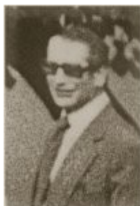
Markus Wolf (1923 – 2006) Chef de la HVA (1956-1986)