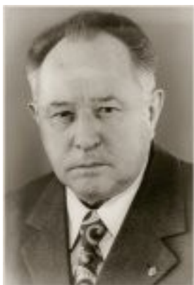
Erich Mielke (1907 - 2000) Ministre de la Stasi (1957 - 1989)