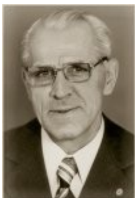
Willi Stoph (1914 – 1999) Président du Conseil d'Etat (1973 – 1976)

Libéré par les Alliés en 1945, il adhère au KPD. L'année suivante, il est membre du SED. Il est aussi l'éditeur et le rédacteur en chef d'éditions locales de quotidiens populaires : Sächsische Volkszeitung (Dresden), Volksstimme (Chemnitz), Freiheit (Halle). En 1963, élu secrétaire général du SED pour la circonscription de Halle, il entre à la Chambre du Peuple. Puis, en 1971, il entre au Conseil des Ministres, qu'il dirige au bout de deux ans. Révoqué en 1976, il accède définitivement au titre de président de la Chambre du peuple, où ses fonctions demeurent essentiellement protocolaires.