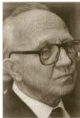
Horst Sindermann (1915- 1990) Président de la Chambre du Peuple (1976 – 1989)

Il retourne en Allemagne à la fin de la guerre dans les rangs de l'Armée Rouge. Puis, il initie l'union entre le KPD et le SPD. En 1949, il est élu président de la DDR, où il devient très populaire. Par ailleurs, bénéficiant de la confiance de Staline, il occupera ce poste jusqu'à sa mort en 1960.