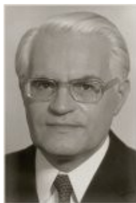
Gerald Götting (1923 - /) Président de la Chambre du Peuple (1969 - 1976)

En 1945, il participe à la création de l'Association Culturelle Allemande, du Parti Libéral Démocrate (LDPD), et deux ans plus tard, de l'Association pour l'Amitié Germano-Soviétique. En 1949, il devient le président de la Chambre du Peuple, fonction qu'il occupera jusqu'à sa mort. Il est aussi membre du bureau du Front National, président de la Fondation des Vétérans pour la Solidarité Populaire, et président de la Délégation Permanente de la DDR à la "Conférence pour une solution pacifique à la Question Allemande".