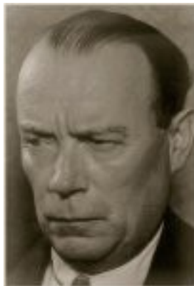
Wilhelm Zaisser (1893-1958) Ministre de la Stasi (1950 – 1953)

en 1950. Suite au limogeage de Wilhelm Zaisser en 1953, il est nommé ministre de la Stasi. Il tente d'étendre les pouvoirs de son ministère, rejoint un groupe d'opposition à Walter Ulbricht, mené au sein même du politbüro du SED par Karl Schirdewan. Mais son influence décline, et il est obligé de démissionner en 1957. Accusé d'activisme contre le SED, il doit quitter le comité central du parti l'année suivante. Après quoi, il quitte définitivement la Chambre du Peuple et se retire à Berlin-Est.