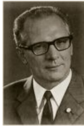
Erich Honecker (1912 – 1994) Chef du conseil d'Etat (1976 – 1989)

Ulbricht. En 1956, lors du congrès du SED, il condamne les abus du système judiciaire, dénonce les arrestations illégales, et appelle à un plus grand respect des droits des citoyens. Il meurt huit ans plus tard d'un cancer du sang.